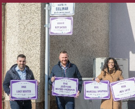
Collège échevinal de Bissen